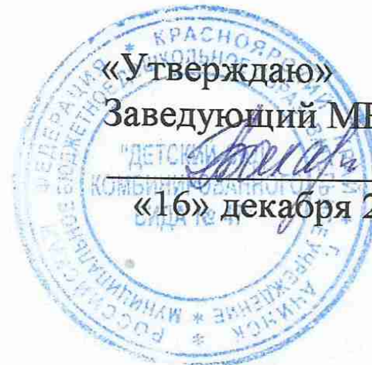
График проведения новогодних утренников 2021-2022уч.г.